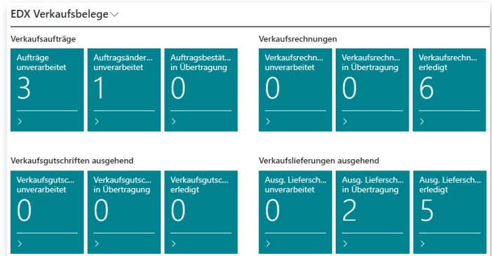
Erweiterung für das Rollencenter